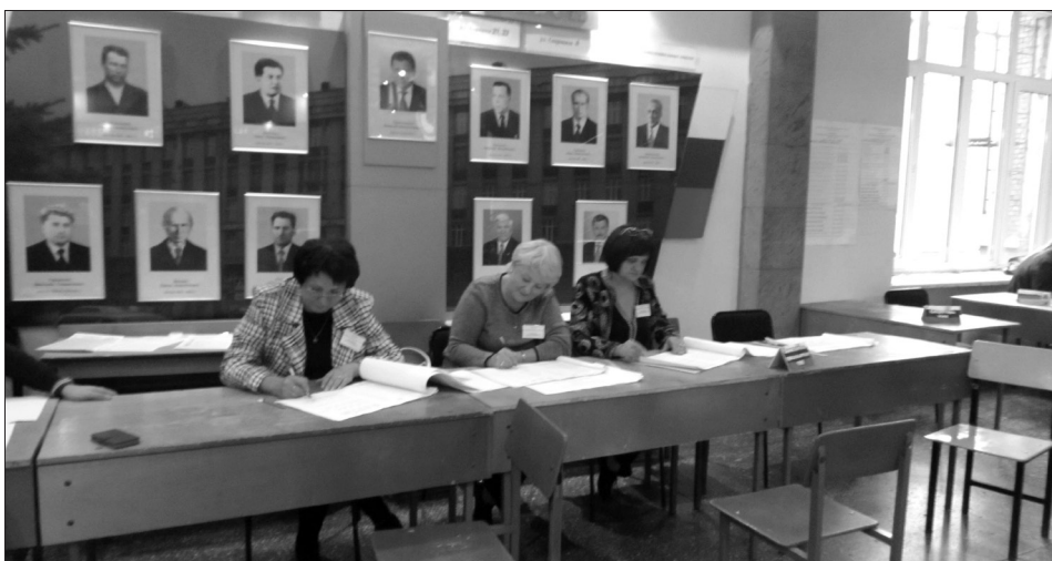
Завершение работы комиссии на нашем избирательном участке

Избирательные участки, располагающиеся на территории СибГИУ, как всегда отличались хорошей подготовкой, обслуживанием, дизайном, волонтерской поддержкой.