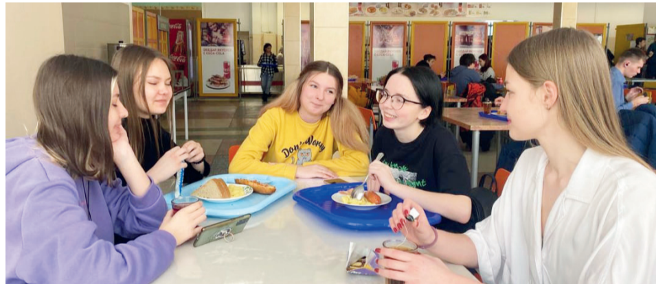
↑ Приятное с полезным так сочетаются!

Самое любимое место в СибГИУ? Конечно же, столовая! С ней у меня связано много смешных, теплых и к тому же вкусных историй! Уверена, что многие студенты со мной согласятся. Посещение столовой – это целый ритуал: ты выходишь (убегаешь, отпрашиваешься, тихо линяешь) пораньше с нервной пары, бежишь изо всех сил по бесконечным лестницам и коридорам, заворачивая резко на поворотах, будто ты в Пекине и от тебя зависит олимпийское золото страны! Наконец добегаешь до святой святых, берешь поднос и стойко отстаиваешь очередь, равную трем переходам из главного корпуса в металлургический. Пока стоишь, думаешь, что