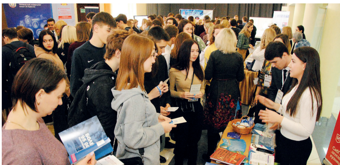
↑ На стенде в СибГИУ в Топках всегда было многолюдно

Продолжается масштабный профориентационный проект День университетов Кузбасса, организатором которого выступило Министерство науки и высшего образования региона при поддержке Министерства образования и НОЦ Кузбасса.