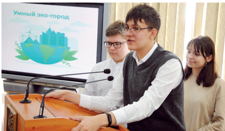
↑ Школьники защищают свои проекты

Четыре дня ребята разрабатывали проекты под руководством модераторов, преподавателей первого вуза Кузбасса. В университете «стратегические решения» принимались на 8 площадках. Темы самые разнообразные: «Я и leap-технологии», «Эргономика и дизайн индивидуального жилого дома», «Экосити Новокузнецк», «Автотранспорт- 2030-2040-2050», «City tracks», «Уголь – черное золото Кузбасса», «Мой первый миллион», «Я будущий айтишник + Умный светофор». Цель одна - сделать город комфортнее. Самые лучшие проекты