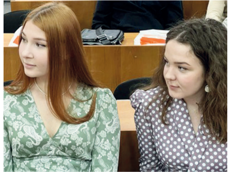
↑ Студентки Института экономики и менеджмента - стажеры РУК

В конце месяца состоялась встреча студентов Института экономики и менеджмента СибГИУ с представителями ЕВРАЗ ЗСМК и Распадской угольной компании. Эти успешные предприятия - давние промышленные партнеры вуза, ищут среди студентов молодых профессионалов для практики и дальнейшей работы в своих структурах.