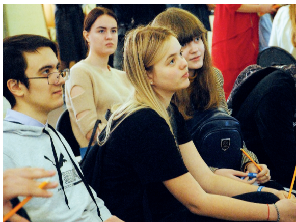
↑ Очень интересно!

Первый вуз Кузбасса рассказывает школьникам о профессиях.