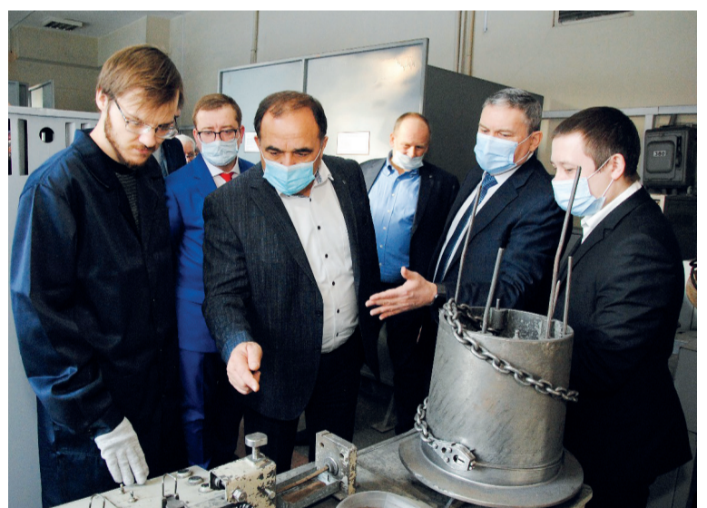
↑ Делегация в лаборатории сварки

Машиностроение является в настоящее время наиболее роботизированной отраслью. Предприятия нуждаются в профессионалах с современным набором компетенций. Выпускать таких спецов будет первый вуз Кузбасса с помощью лидера в области автоматизации производства – FANUC. В СибГИУ появится лаборатория, где студенты будут работать на современном оборудовании. К примеру, в новом образовательном пространстве у студентов появится возможность обучаться управлению процессом роботизированной сварки.