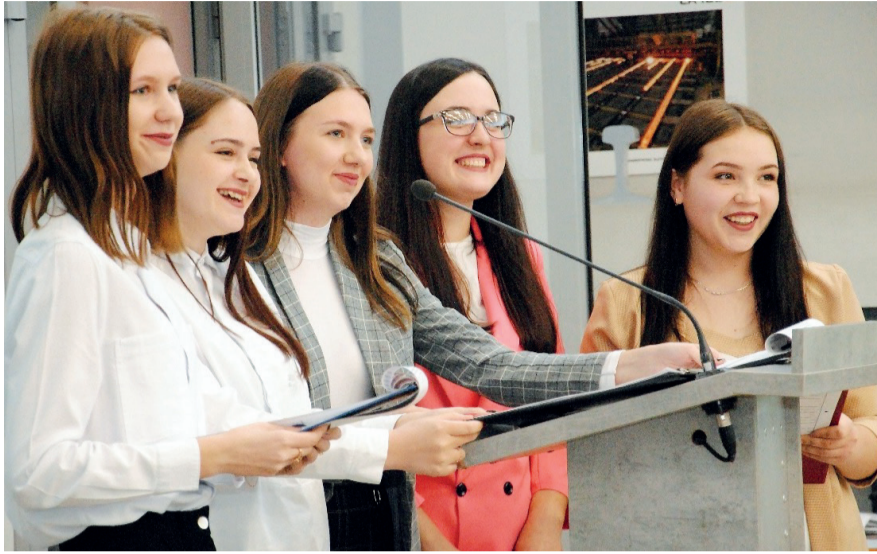
↑ Металлургия тоже женского рода!