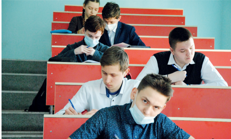
↑ Ребята - участники олимпиады

Инициатором и организатором конкурса выступили: Центр детского (юношеского) технического творчества "Меридиан", г. Новокузнецк, Кузбасский центр «Дом юнармии», г. Кемерово, при поддержке Министерства образования и науки Кемеровской области.