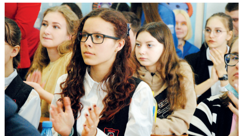
↑ Болеем за своих

Интересную идею предложили ребята в проекте «Модульные здания в городской среде