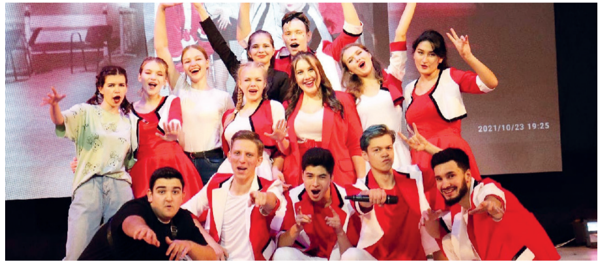
↑ Финал студенческого праздника "Первый шаг"

Культурный центр СибГИУ... Конечно, это особое место, которое живет атмосферой творчества и вдохновения. В КЦ много мест, где активисты могут отдохнуть. Это может быть мраморный зал, наполненный теплом и светом солнечных лучей. Или большой концертный зал, где можно уединиться со своими мыслями. Кому-то из ребят нравится приходить по расписанию в танцклассы, потому что в них царит атмосфера репетиций и сосредоточенности.