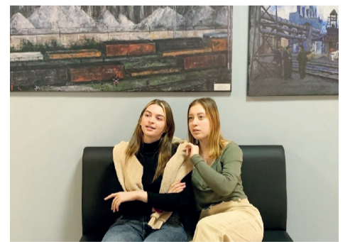
↑ Студентки ИПО в галерее

Для тех, кто любит селфиться и делиться яркими снимками в социальных сетях, эта галерея является замечательной фотолокацией.