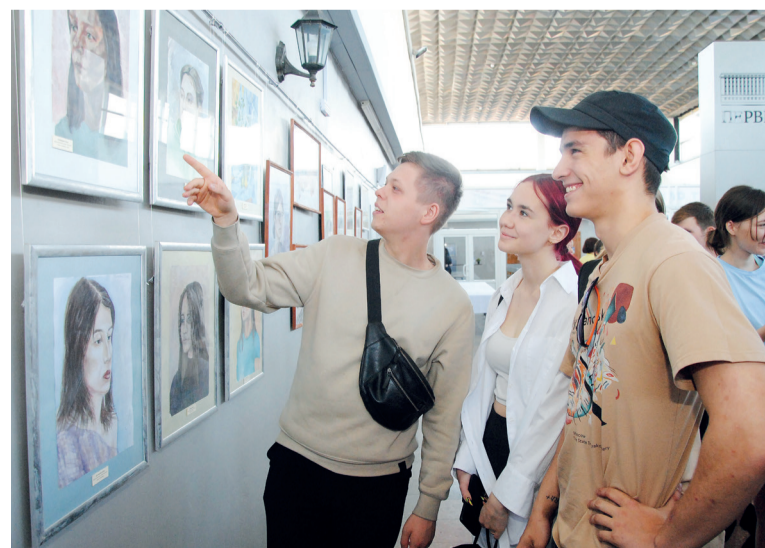
↑ Узнали, кто нарисован!