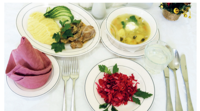
↑ Любишь покушать – люби и тапочки носить. В профилактории все рядом – столовая на этаже, сюда ты можешь зайти прямо в тапках, после душа.