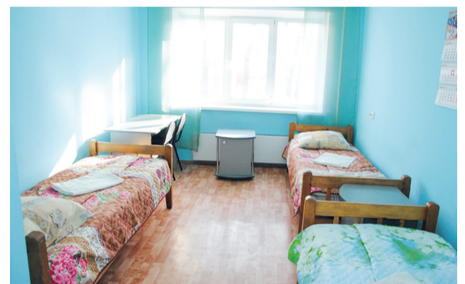
↑ Твоя будущая комната. Тихо, светло, спокойно. Вечером – дискотека.

шей крышей? Студент может получать процедуры физиолечения, к его услугам ингаляторы, кабинет лечебной физкультуры. Кроме того, наш гость находится всегда под медицинским присмотром терапевта.