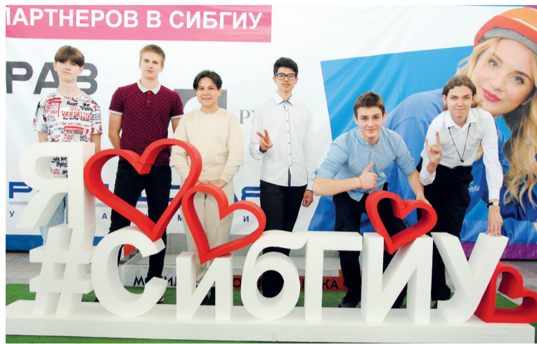
↑ В блоке поточных аудиторий

«СибГИУ – передовой вуз! Много интересного, цифровых технологий. Я смогу здесь многому научиться»