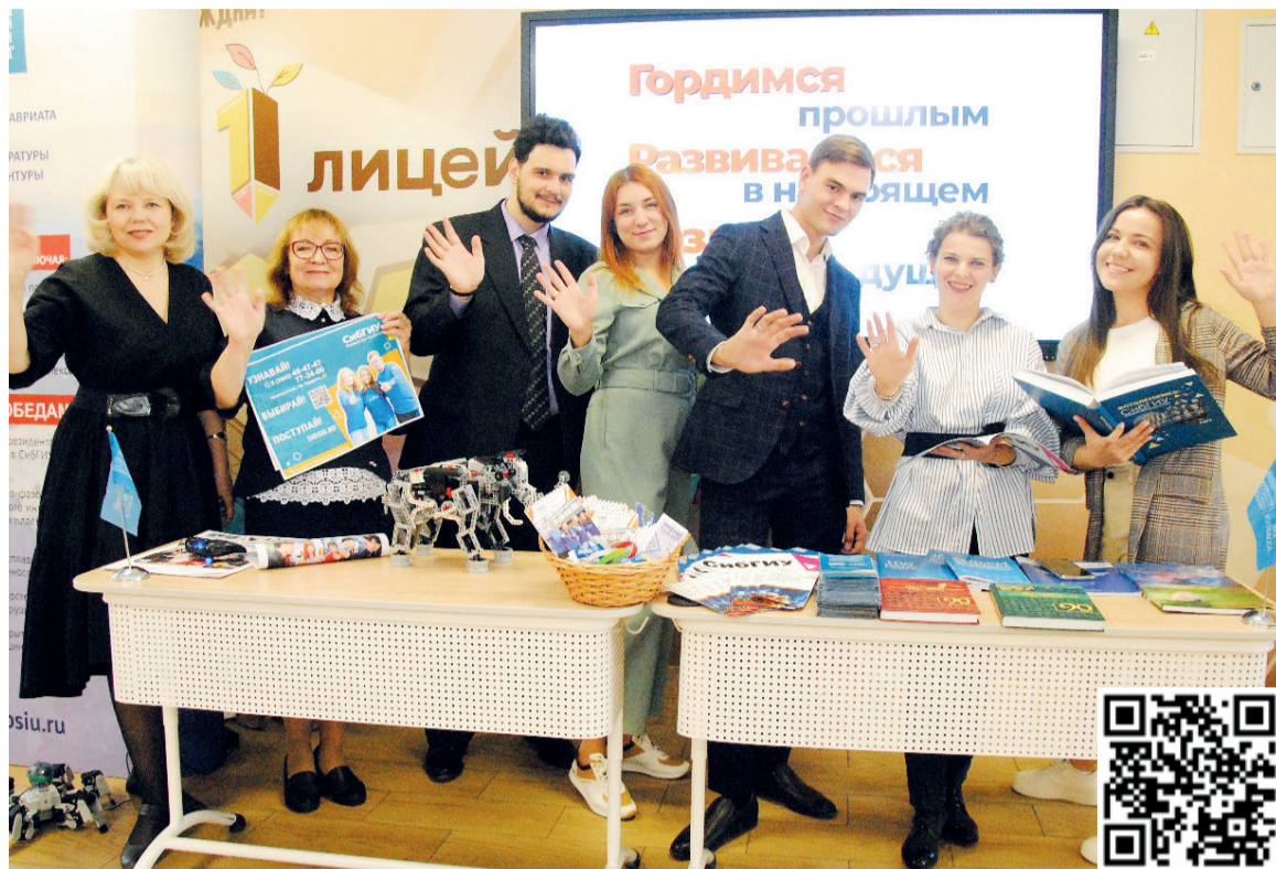
↑ На стенде СибГИУ в Киселевске

В СибГИУ в мае продолжились мероприятия в рамках проекта «Дни университетов Кузбасса». Наша делегация с насыщенной презентационной программой побывала в лицее №1 Киселевска. На встречу с СибГИУ пришли практически