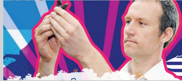
Ученый вуза изобрел резец "Кузбасс 300" - 6 стр.