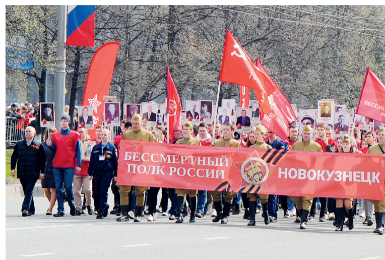
↑ Студенты СибГИУ возглавили колонну Бессмертного полка