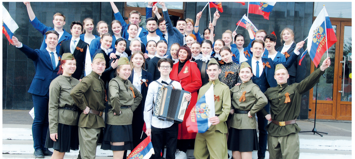
↑ Студенты и преподаватели университета завершили митинг Дня Победы

9 Мая на площадке главного входа СибГИУ состоялся традиционный торжественный митинг, посвященный празднованию Победы в Великой Отечественной войне.