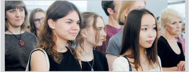
Портреты друзей и натюрморты средневековья - от студентов-архитекторов - 5 стр.