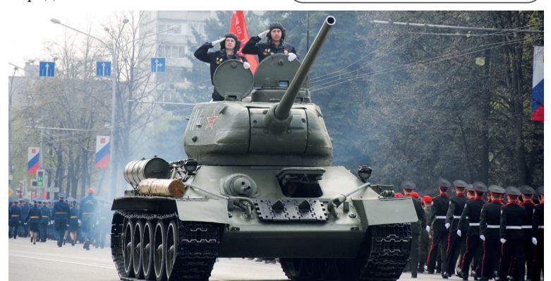
↑ Начался городской парад, посвященный 9 Мая