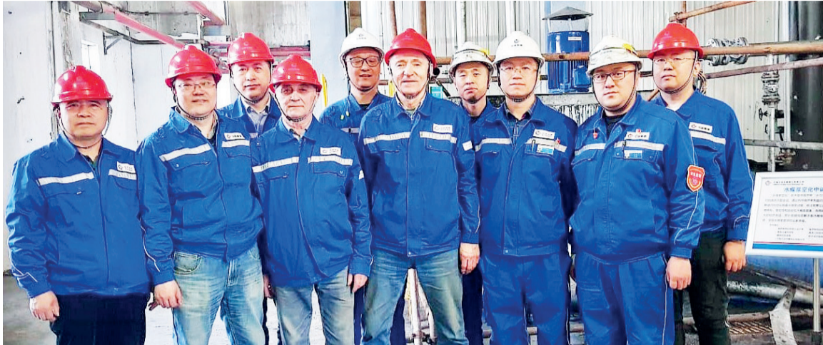
↑ Группа ученых СибГИУ с китайскими друзьями

На углехимическом комбинате в г.Хэган в Китае прошли успешные испытания экспериментального образца специального «насоса-активатора». Насосный агрегат разработан при участии ученых нашего Центра инновационных угольных технологий и НПЦ «Сибэкотехника».