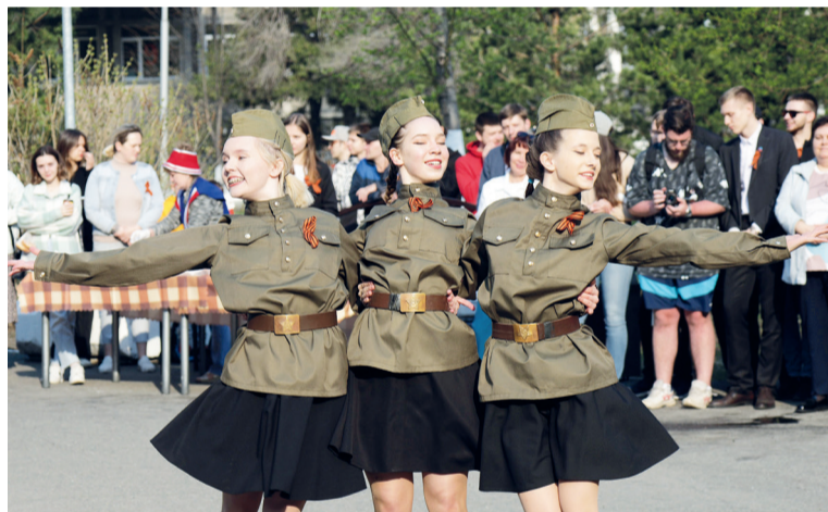
↑ Студенты подготовили яркую программу - танец под музыку военных лет

Мария Шлемина, корреспондент ST-Media, после праздничной программы взяла ин-