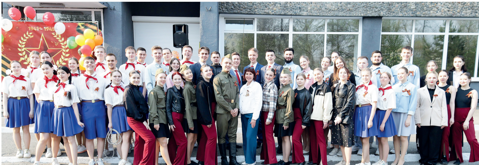
↑ Закончился митинг Победы, танцоры и певцы сфотографировались на память