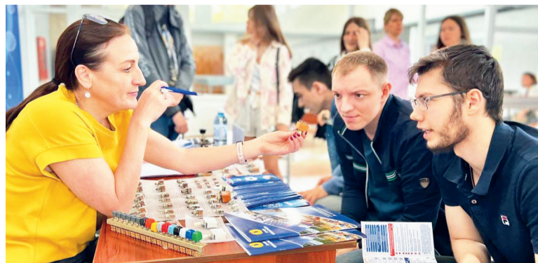
↑ Марафон карьеры

Для «технаря» главное - база знаний. Поэтому работодатели региона охотно участвуют в Карьерном марафоне СибГИУ.